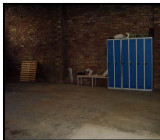
Garatge i "vestidor" a Tremp. Taquilles.