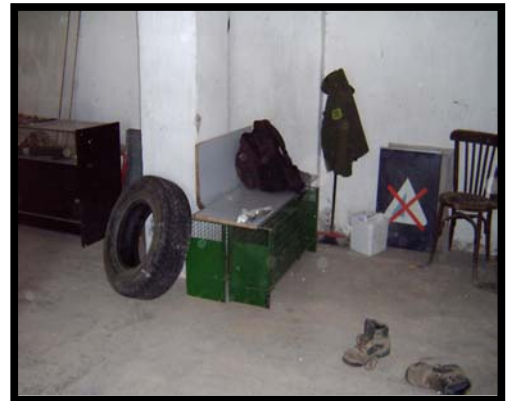
Garatge i "vestidor" a Cervera.

També hi manca la habilitació de les dependències d'aquest local: vestidors , cuina , despatxos, sala de comissos, etc.