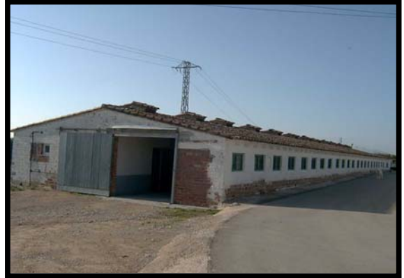
Garatge dels vehicles al Baix Ebre. En teoria en aquesta granja hi haurien d'haver-hi els vestidors, dutxes, etc.

La Base de la Comarcal està situada en els locals del DARP . En aquest locals els agents rurals disposen d'un sol despatx per a tots els agents i el cap de comarca. Els vehicles es tanquen en una antiga granja de pollastres habilitada com a garatge per als agent rurals. Aquesta esta ubica a 2 o 3 km del casc urbà. Aquesta també té una evident manca de higiene i salubritat.